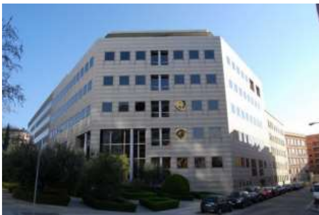
La sede del Consejo Oleícola Internacional Calle Príncipe de Vergara 154 en Madrid

http://www.internationaloliveoil.org/store/index/48-olivæ-publications