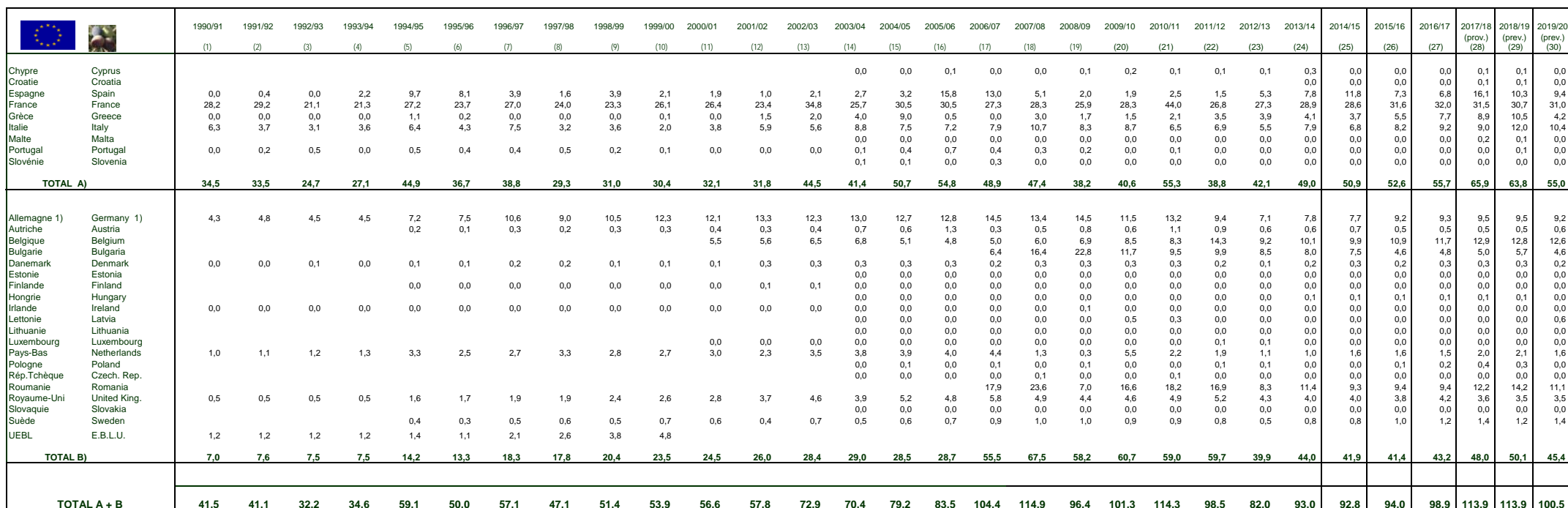
Tableau 2 : IMPORTATIONS EXTRA-CE (1.000 tm) - Table 2 : EXTRA-EC IMPORTS (1,000 tonnes)