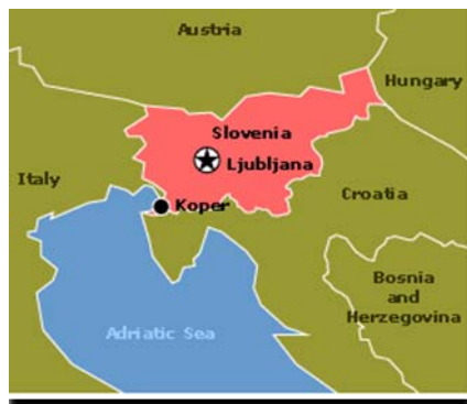
Figure 1. Situation géographique de la Slovénie

En Slovénie, les possibilités de culture de l'olivier sont limitées à une étroite région du pays. Les oliveraies sont principalement situées dans la région de l'Istrie et certaines zones de Primorje qui bénéficient d'un climat sub-méditerranéen.